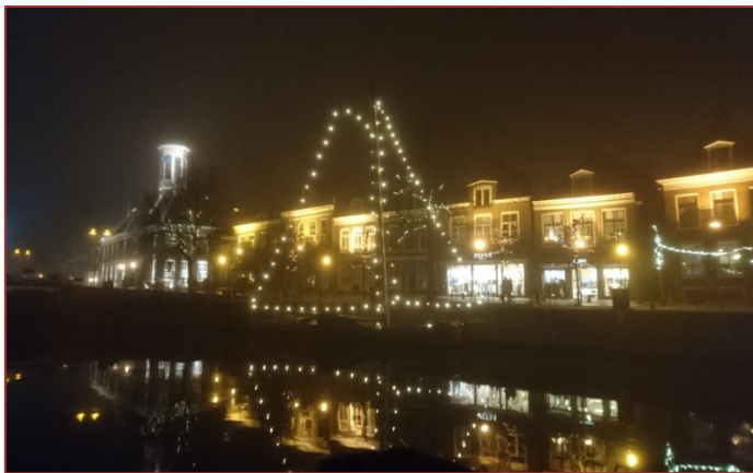
De verlichting van De Noarderling is mogelijk gemaakt door een bijdrage van het Dokkumer Stadsfonds.

Het zal u niet zijn ontgaan: afgelopen winter lagen er in het Grootdiep meerdere traditionele schepen. Mede dankzij De Noarderling krijgt de door de gemeente gewenste museumhaven dus langzaam gestalte. Hopelijk krijgt dit een vervolg en liggen er volgende winter nog meer schepen. En het zou helemaal mooi zijn als De Noarderling ook in de zomer gezelschap krijgt van andere historische schepen.